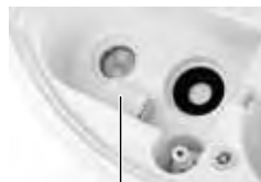
Antibakteriálna strieborná kocka