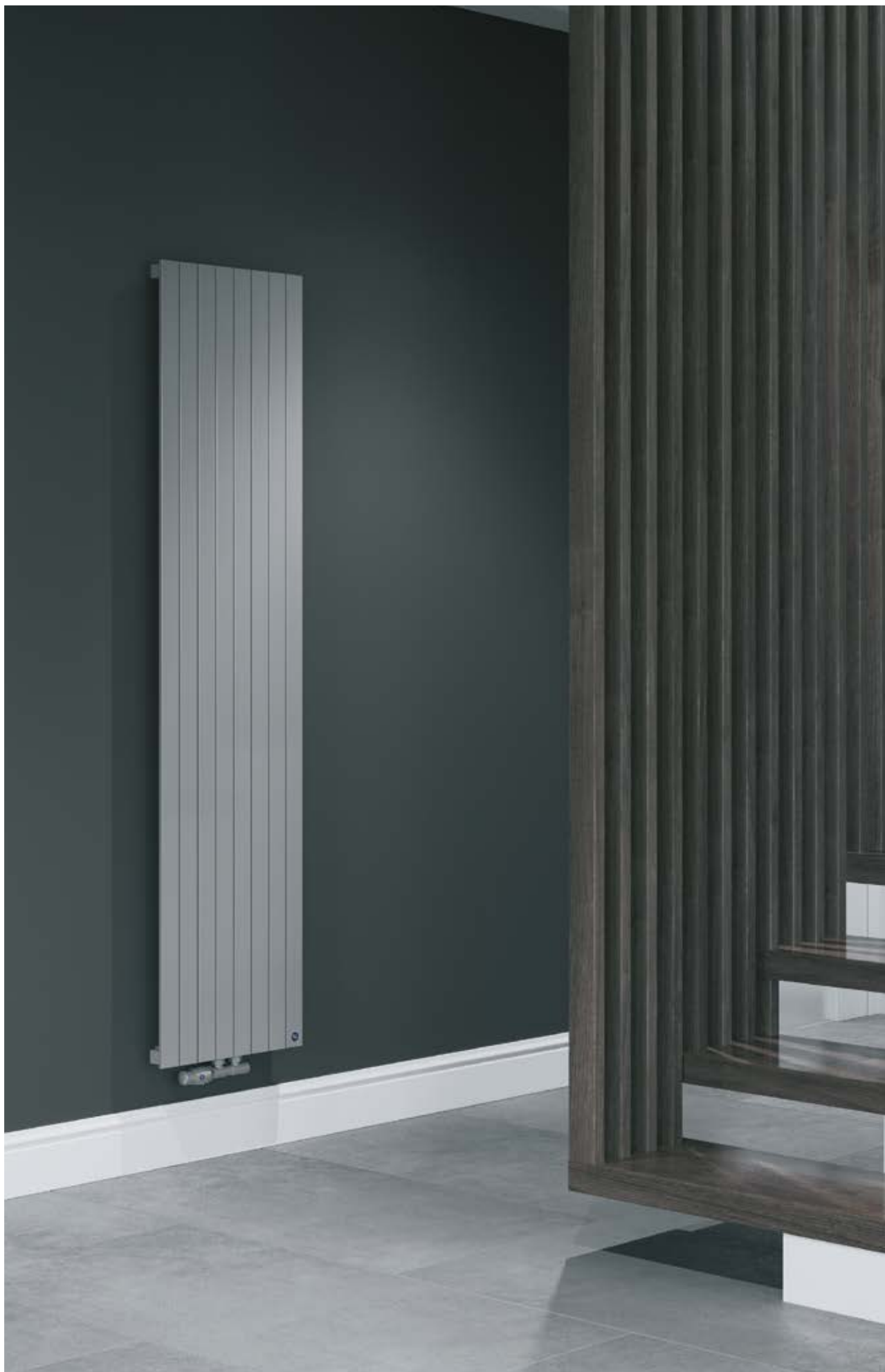
Na aranżacji: grzejnik c.o. COWN-180/08C71, zestaw zaworowy Z15