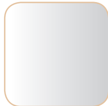
SREBRNE SILVER / L01 / L01

DOSTĘPNE KOLORY LUSTRA available mirror colours