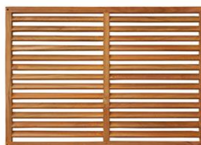
x1 face avant