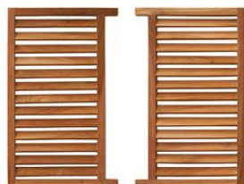
x2 côté droit & gauche