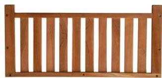
x 1 dessus (dessous en option)