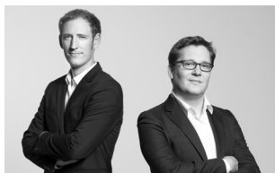
Dizajn: Bernard / Burkhard

Ďakujem všetkým, ktorí sa zúčastnili prác na tomto projekte: Delovi Xu – za organizáciu v Ázii, Johnovi Ye – za vývoj, technické spracovanie a prácu v CADe, Mariovi Rothenbühlerovi – za fotografie, Fabianovi Bernhardovi a Thomasovi Burkardovi – za nádherný elegantný dizajn, Mattimu Walkerovi – za grafické práce.